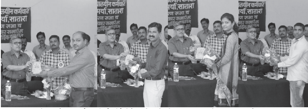
प्रमुख पाहुण्यांच्या हस्ते न्यायालयीन कर्मचारी यांनी विशेष प्राविण्य मिळविल्याबद्दल सन्मान चिन्हा व पुष्पगुच्छ देवून सत्कार करताना